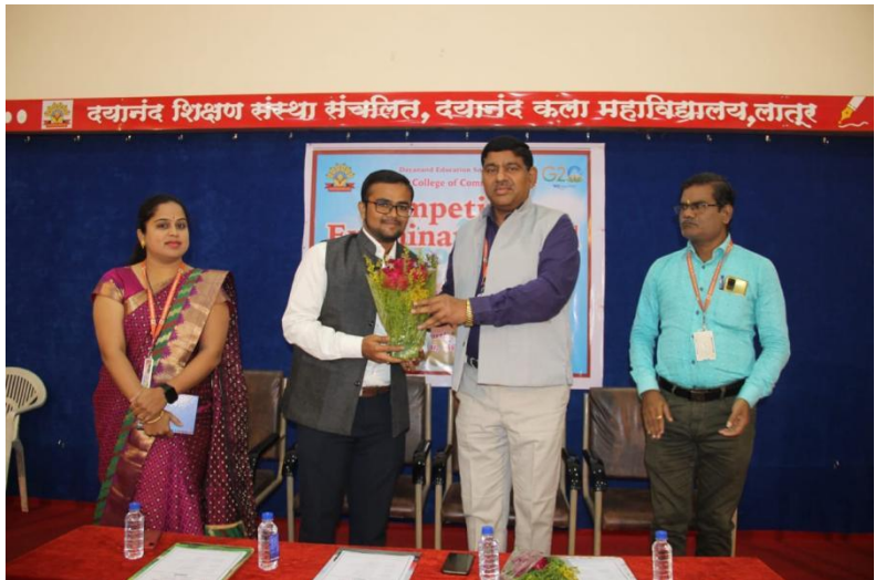
Guest lecture on “Competitive Exams: Challenges & Opportunities.”