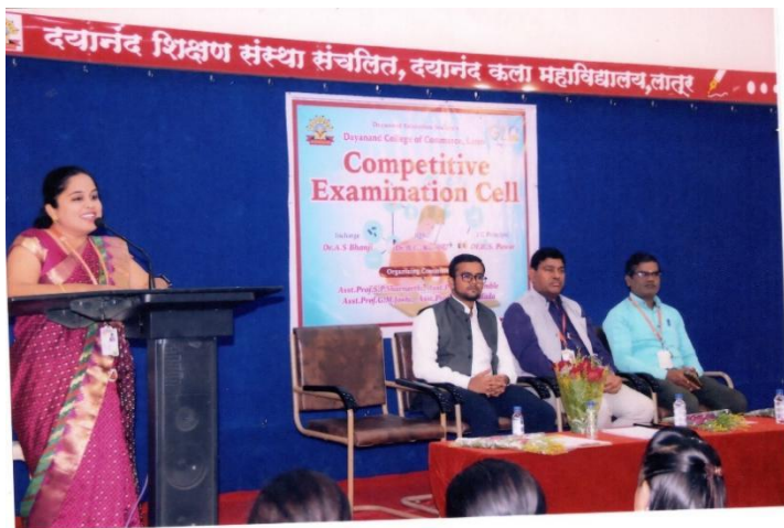
Guest lecture on “Competitive Exams: Challenges & Opportunities.”