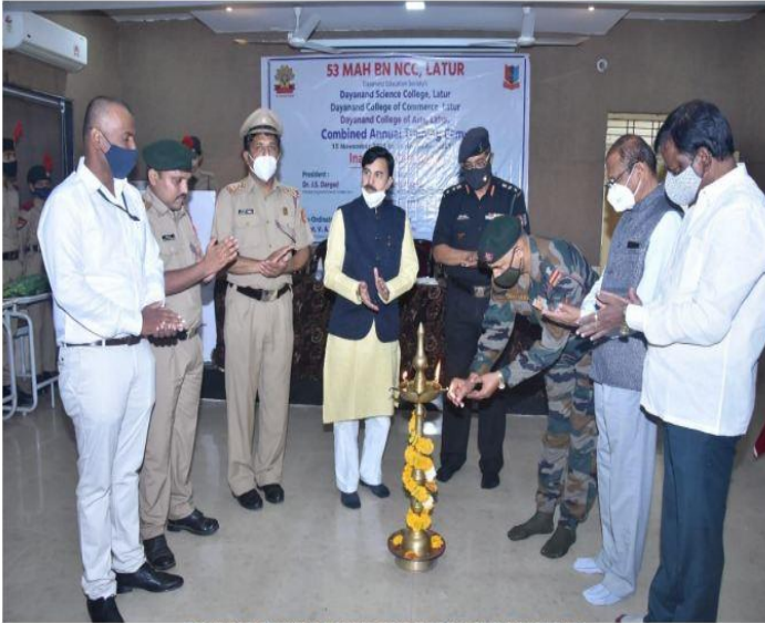
INAUGURATION FUNCTION OF CATC CAMP