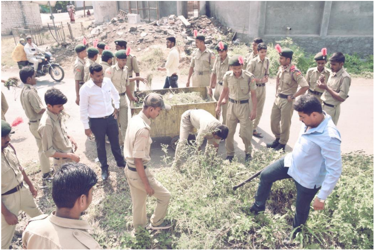
Arrival with the NSS volunteers at the adopted village Nadihattarga, Tq-Nilanga, Dist-Latur (11/01/2019 To 17/01/2019)