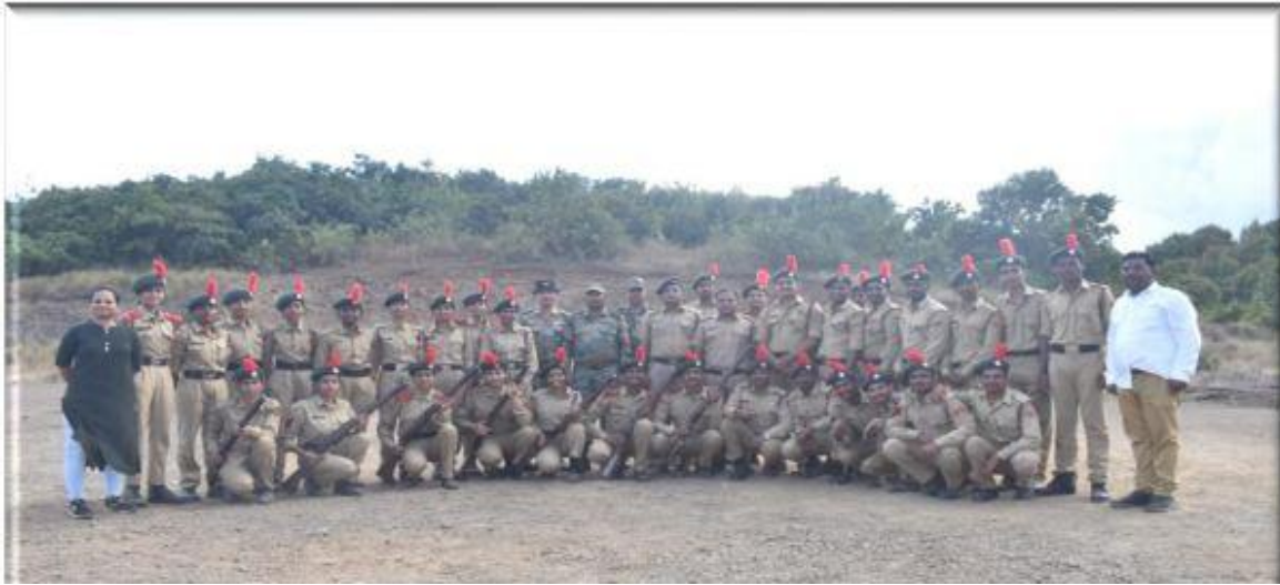
Covid Warriors Prize Distribution Ceremony (19/05/2022)