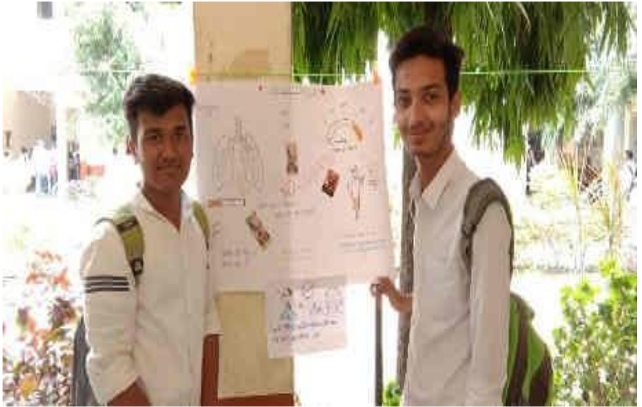
Blood donation camp