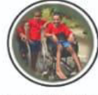
Locomotor Disability अस्तिथ्येग