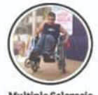
Multiple Sclerosis एकअधिक स्केलेरोसीस