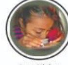
Low Vision अल्पदृष्टी