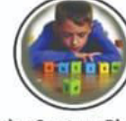
Autism Spectrum Disorder स्वभावात