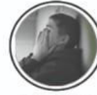
Mental Illness मानसिक रोग