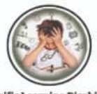
Specific Learning Disability विलिखि शिक्षण अहमता