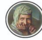
Leprosy Cured कुष्ठ रोग मुक्त