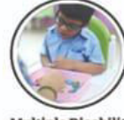
Multiple Disability अदुधिकाअंगता