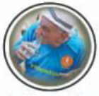
Parkinson's Disease पार्किन्सनस रोग