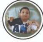
Cerebral Palsy मैदुया पक्षाघात