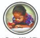
Intellectual Disability बौद्धिक दिव्यांगता