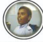
Hearing Impairment श्रवण अाधिति