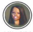
Acid Attack Victim तेजाव अाकणग पिडीत