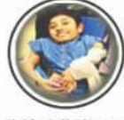
Sickle Cell Disease सिकल सेल रोग