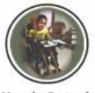
Muscular Dystrophy म्यादुसी विकृती