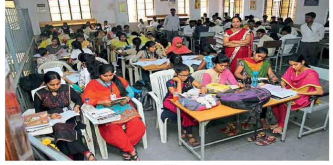
लातूर : येथील दयानंद वाणिज्य महाविद्यालयात आयोजित एकच ध्यास १८ तास अभ्यास उपक्रमात सहभागी झालेले विद्यार्थी.

Aurangabad, Latur-Today 13/04/2019 Page No. 1