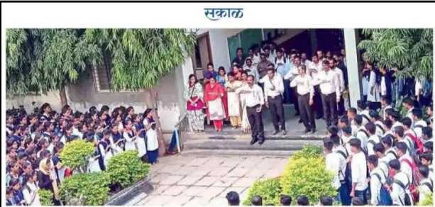
लातूर : सद्भावना दिनानिमित्त दयानंद महाविद्यालयातील विद्यार्थ्यांनी मंगळवारी सामुदायिक शपथ घेतली.