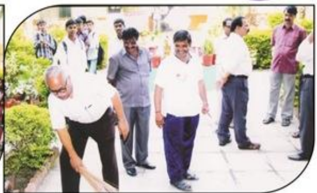
Clean India Campaign in the college campus on the occasion of Mahatma Gandhi Jayanti & Lal Bahdur Shastri Jayanti Dt. 02 Oct. 2014.