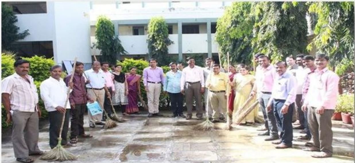
Under clean India mission NSS department organize clean campus programme dated 11/10/2017