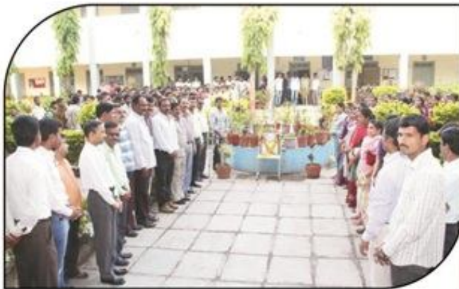
Celebration of Mahatma Gandhi Jayanti.