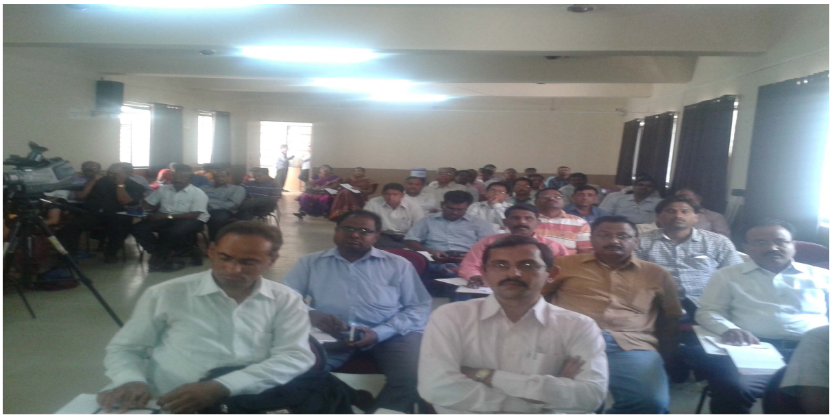
Participants Enjoying the Session on Financial Awareness and Investment Avenues in Securities Market on 27 th March 2015