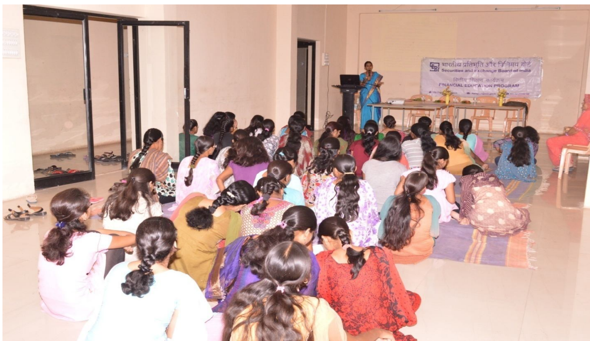
The Participants in the Financial Education Training Programme conducted at Dayanand Science College,Latur on 29th September 2019