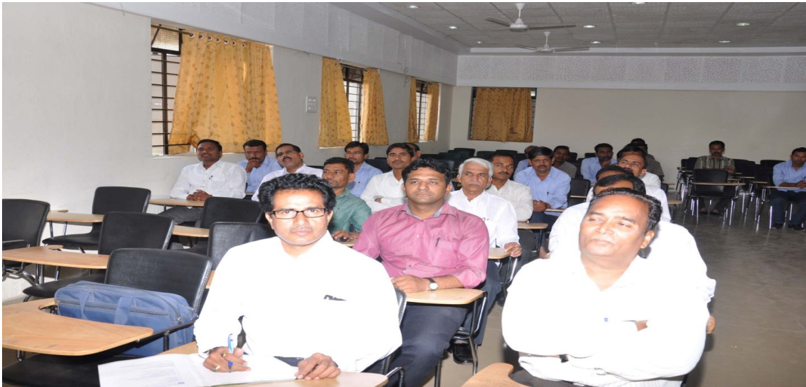
Dayanand Science College Staff (Participants) Enjoying Session on Financial Education on 17 th September 2014