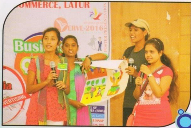
‘व्हर्व २०१६’ मॅनेजमेंट इव्हेंट मध्ये स्वच्छ भारत अभियानाचा संदेश देताना महाविद्यालयातील विद्यार्थिनी

The College organizes Annual Function every year. This function was organized on 23 rd to 25 th Jan, 2017. Cultural cell presents different cultural events by conducting audition from many interested students and selected events are presented on the stage.