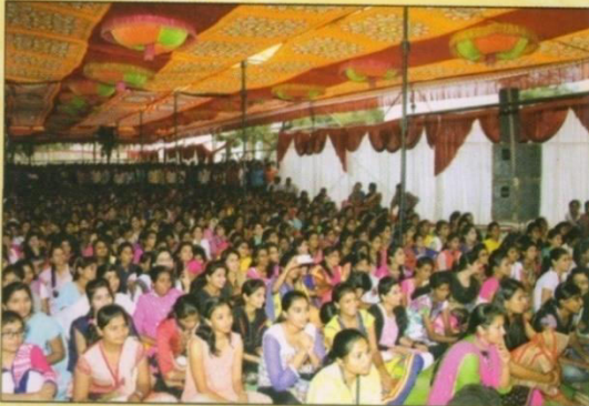
वार्षिक स्नेहसंमेलन प्रसंगी स्नेहसंमेलनातील विविध कार्यक्रमांचा आस्वाद घेताना महाविद्यालयातील विद्यार्थिनी.